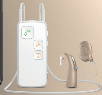
ConnectLine App, Oticon Medical Streamer XM, Neuro 2